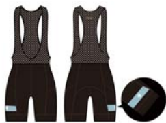
カペ袋限定ポケットサイクルパンツ スカイハイ (青空)

さらに新たな選択肢として、カペ袋半袖ジャージと対になるデザインのサイクルパンツをご用意いたしました。カペ袋ウエアのお渡しは4月上旬。寒さも和らぎ、心地よいサイクリングを楽しめる季節です。2021年はみんなでの特別なジャージを着て、春夏シーズンを満喫しませんか？