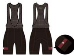
カペ袋限定ポケットサイクルパンツ サンセット (夕焼け)