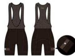
カペ袋限定ポケットサイクルパンツ ミッドナイト (夜空)