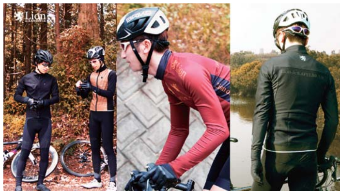
▲Lion de KAPELMUUR